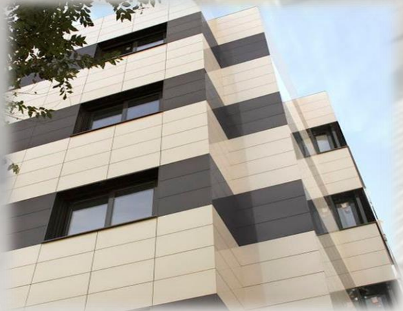
Mur TERRE CUITE