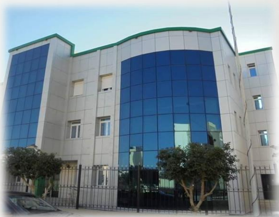
Mur rideau VEC

Que ça soit en VEC , capot-serrure , terre cuite ou ALUCOBAND ,