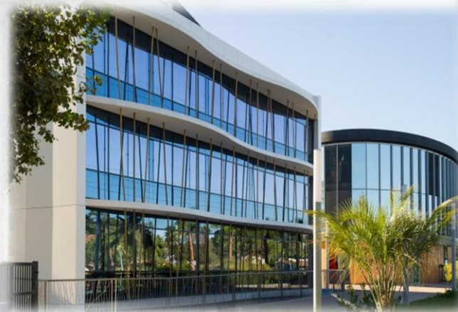
Mur rideau CAPOT SERRURE